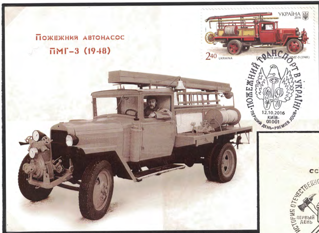
Пожарный автосос ПМГ-3 (1948)

Пожарное депо г. Тамбов и пожарная техника довоенного и военного периодов на вооружении пожарных Тамбовской области