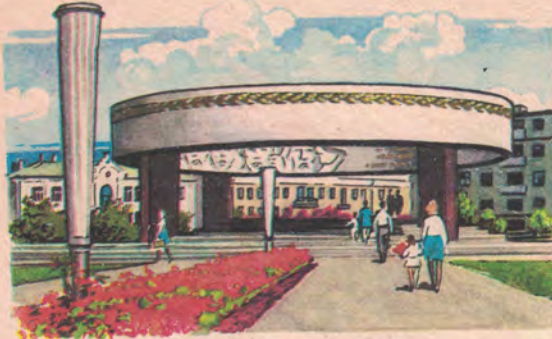
ТАМБОВ. Памятник воинам-тамбовцам, героям Великой Отечественной войны